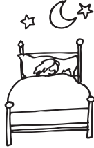
in der Nacht